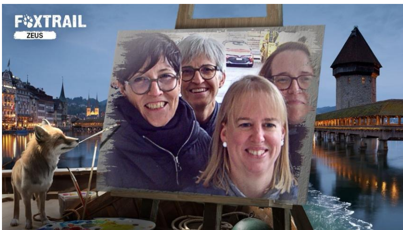
Team-Ausflug: Foxtrail erfolgreich abgeschlossen - wir waren richtig gut!

Literaturclub vom SRF, Papiersaal Zürich